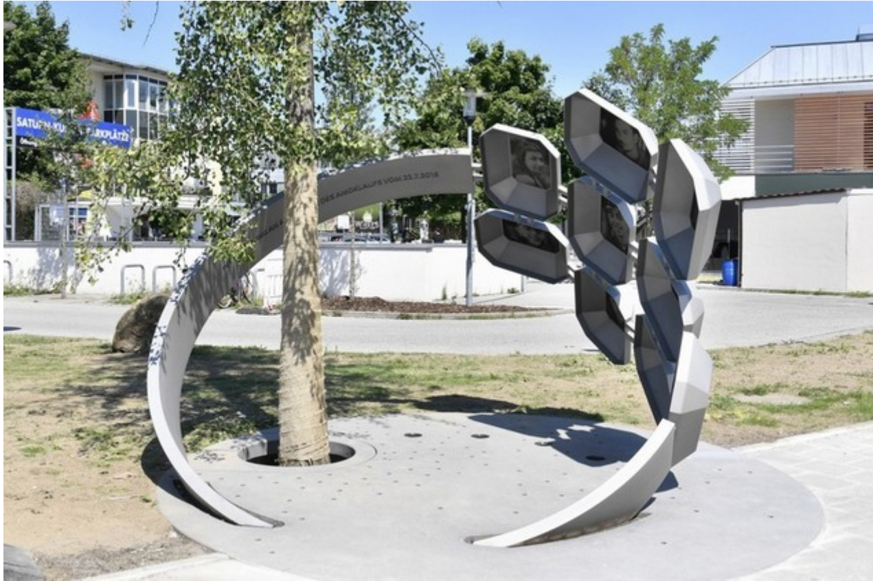
Elke Härtel, „Für Euch“, 2017 (Hanauer Str. 74)

Denkmal für alle Opfer des rassistischen Attentats vom 22. Juli 2016